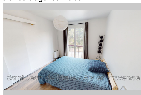
Saint Jean de Malte - Aix en Provence