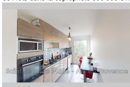
Saint Jean de Malte - Aix en Provence